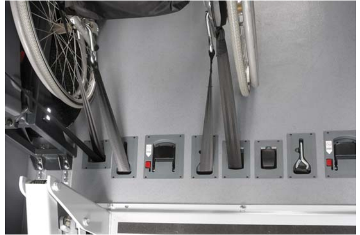
Die Rollstuhlbefestigung in Minibussen wird mit Smartfloor-PLUS noch einfacher!