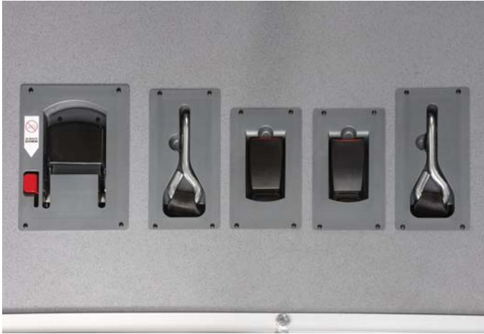
Die Einzelkomponenten des neuen Einbau-Rollstuhlhaltungssystem- Smartfloor-PLUS. Flach im Boden integriert.