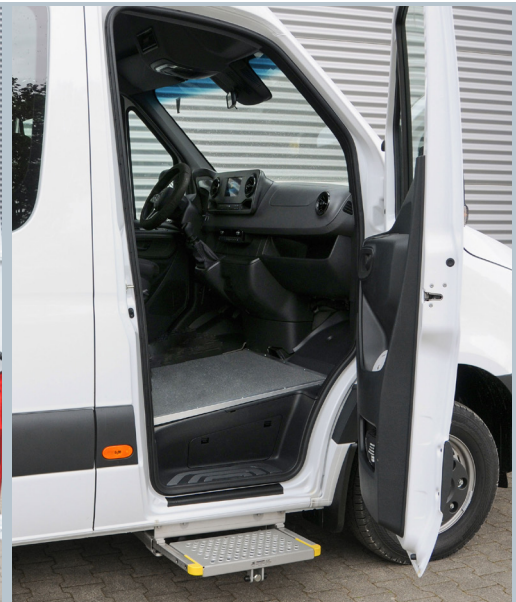
Vollautomatische AMF-Bruns Trittstufe im Einstiegsbereich.