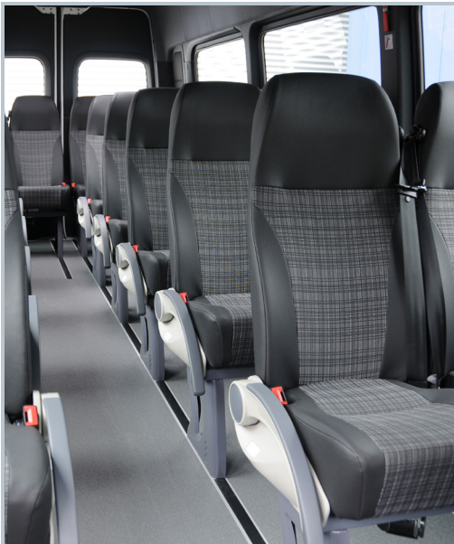
Komfortable und ergonomisch geformte M2 Einzelsitze.

Mercedes-Benz Sprinter - M2 Bus (13 - 19 Sitzler)