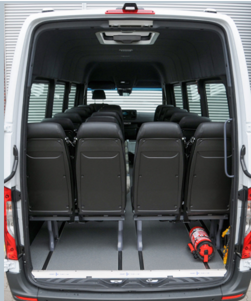
Der AMF-Bruns Smartliner bietet einen großzügigen Innenraum.