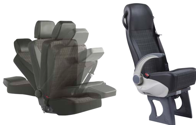
Smartseat Care M1

Ansprechendes Design und bequemer Sitzkomfort machen den neuen Smartseat M2 zum echten Highlight in jedem M2 Bus.